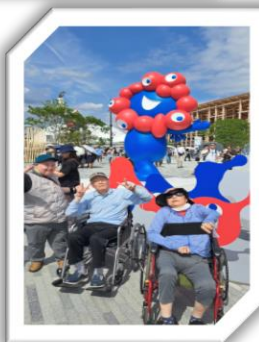
外出 (大阪・関西万博)