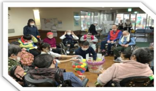
レクリエーション (玉入れ)