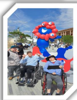
外出 (大阪・関西万博)